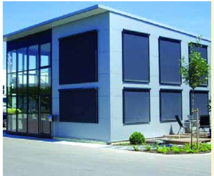
TSB-ZENTRALE IN GUNDELFINGEN: Von hier aus werden die Geschäfte gemanagt.

Bei besonders ausladenden Transportgütern wie etwa Papiermaschinen ist es darüber hinaus notwendig, die Touren gewissenhaft vorzubereiten. Das ist z. B. dann der Fall, wenn Höhen oder Breiten einen kritischen Transport überschreiten. Beitinger: „Eine Brücke kann laut Papierdaten eine Durchfahrtshöhe von 4,30 m haben. Wenn der Fahrbahnbelag mal erneuert wurde, können aus den 4,30 m schon mal 4,25 m werden. Das wiederum kann das vorläufige und vor allem teure Ende für einen Transport sein.“ Grund genug für ihn und sein Team, im Zweifelsfall eine Strecke im Vorfeld abzufahren und an allen neuralgischen Punkten genau nachzumessen. „Das ist zwar zunächst ein enormer Auf-