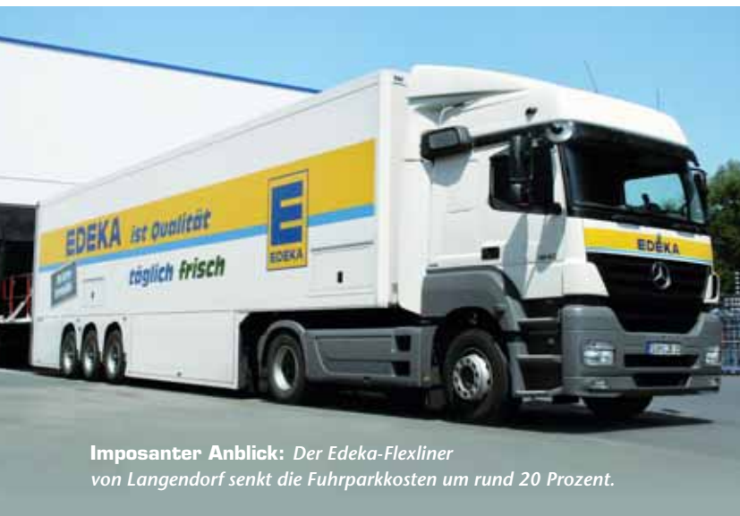
Imposanter Anblick: Der Edeka-Flexliner von Langendorf senkt die Fuhrparkkosten um rund 20 Prozent.

Der Transport von Lebensmitteln ist eine sensible Angelegenheit. Das liegt zum einen an den unterschiedlichen Anforderungen, die die jeweiligen Lebensmittel erfordern, zum anderen an dem Thema Wirtschaftlichkeit. Diesen Herausforderungen stellt sich auch die Edeka-Regionalgesellschaft Hessenring mit Sitz in Melsungen.