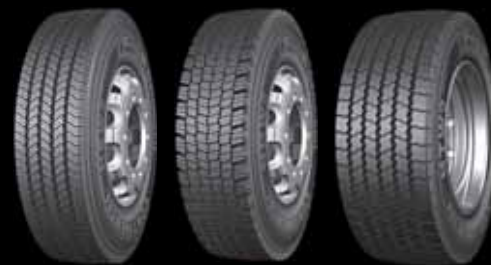
HSW 2 Scandinavia