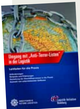
Terrorabwehr: Die Logistik-Initiative Hamburg stellte den neuen Leitfaden vor.

Die Logistik-Initiative Hamburg hat den Leitfaden „Umgang mit Anti-Terror-Listen in der Logistik“ herausgebracht. Dieser soll Unternehmen helfen Sicherheitsbestimmungen richtig anzuwenden. Denn Unternehmen sind dazu verpflichtet, zu verhindern, dass direkte oder indirekte Geschäftskontakte zu Terrororganisationen aufgebaut und unterhalten werden. Auf rund 50 Seiten gibt er vor allem klein- und mittelständischen Unternehmen Hinweise für eine Anpassung an die verschärften Sicherheitsanforderungen.